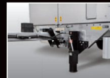
Stufenlos höhenverstellbare Zugeinrichtung und Stützwinde unter Niveau der Ladefläche