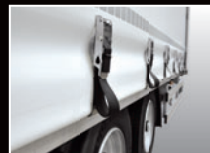
Einstellbare Planenspanner für den Außenrahmen

(alle Angaben verstehen sich als ca.-Angaben)