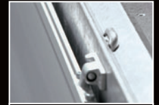
Sicherheits-V-Zurrnut und Verzurrbügel zur Ladungssicherung mit dem Außenrahmen verbunden