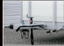
Rohrzugdeichsel mit klappbarem Stützrad

* Auflastung auf 6500 kg zul. Gesamtgewicht möglich (nicht mautfrei)