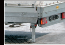
Massiver Stützfuß zur Heckabstützung zum Beladen ohne Zugfahrzeug